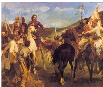
Veszprémi Endre: II. Rákóczi Ferenc és Esze Tamás találkozása

Minden érdeklődőt szeretettel várunk! A belépés díjtalan!