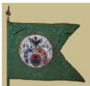
Kuruc lovassági zászlók (1706.)

„Az úr engem eszközül használa, hogy fölébresszem a magyarok keblében a szabadságnak szerelmét.” /II. Rákóczi Ferenc/