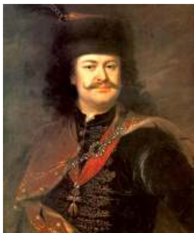
Mányoki Ádám: A nagyságos fejedelem