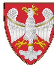
Lengyel címer XIII. század

Az Együttműködés Isaszegért Egyesület és az Isaszegi Falumúzeum szeretettel meghívja Önt és kedves családját, a középkori Szent Márton-templomban 2013. június 8-án, 15 órakor kezdődő lengyel délutánra